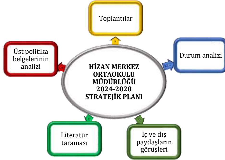
Şekil 1: Stratejik Plan Hazırlık Aşamaları