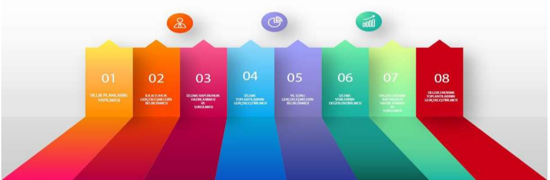
Şekil 5: İzleme ve Değerlendirme Süreci

İzleme ve değerlendirme sürecinin işleyişi ana hatları ile aşağıdaki şekilde özetlenmiştir. Müdürlüğümüz 2024–2028 Stratejik Planı'nda yer alan performans göstergelerinin gerçekleşme durumlarının tespiti yılda iki kez yapılacaktır. Ara izleme olarak nitelendirilebilecek yılın ilk altı aylık dönemini kapsayan birinci izleme kapsamında, Okul Müdürlüğü tarafından birimlerinden sorumlu oldukları performans göstergeleri ve stratejiler ile ilgili gerçekleşme durumlarına ilişkin veriler toplanarak konsolide edilecektir. Performans hedeflerinin gerçekleşme durumları hakkında hazırlanan “Stratejik Plan İzleme Raporu” Okul Müdürü, Müdür Yardımcıları, Öğretmenler ve kurum içi paydaşların görüşüne sunulacaktır. Bu aşamada amaç, varsa öncelikle yıllık hedefler olmak üzere, hedeflere ulaşılmasının önündeki engelleri ve riskleri belirlemek ve yıllık hedeflere ulaşılmasını sağlamak üzere gerekli görülebilecek tedbirlerin alınmasıdır.